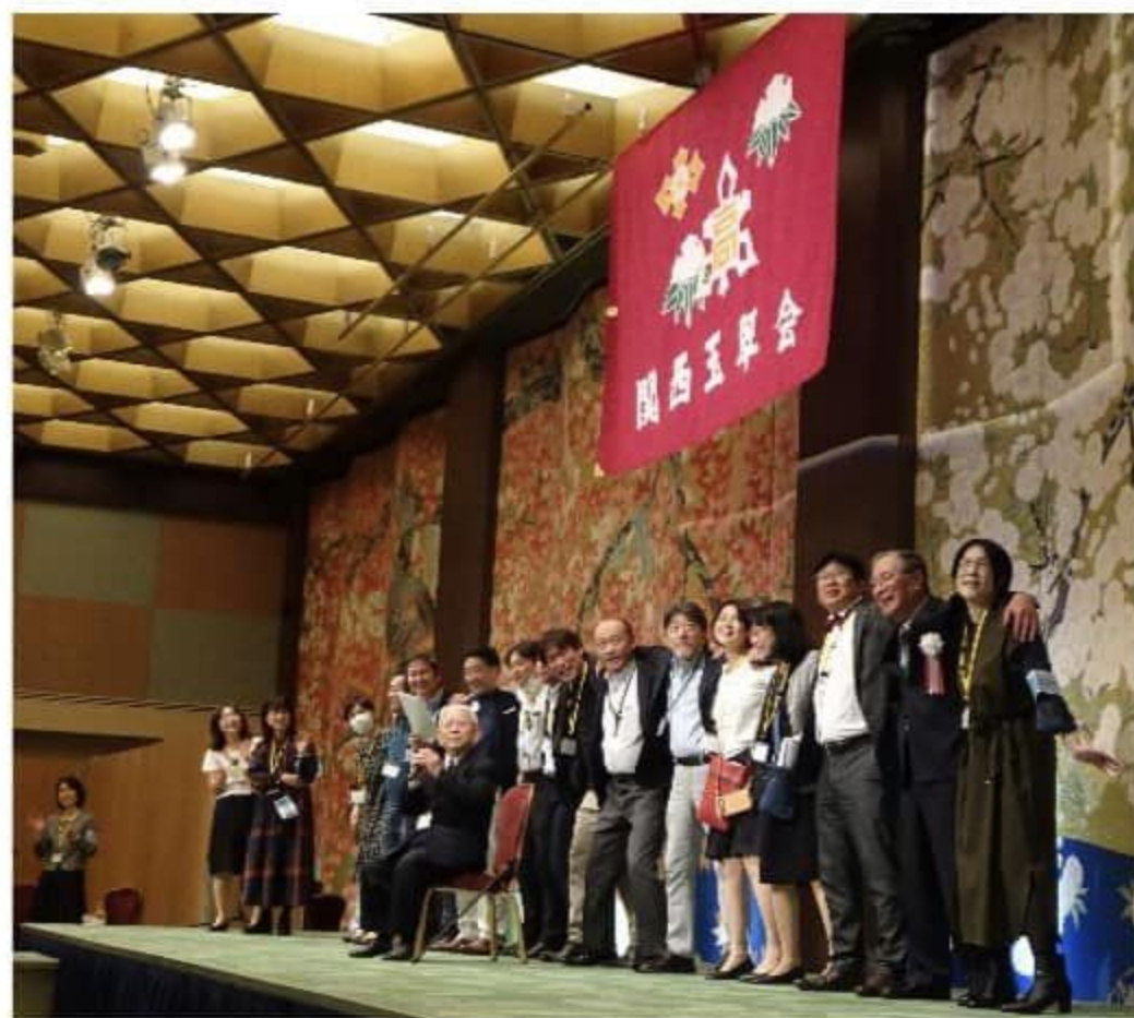
H4年卒幹事メンバーと関西玉翠会役員登壇

我々平成4年卒幹事団は、32年前の旧校舎と新校舎の両方で高校時代を過ごすという貴重な経験をしました。記念総会ということで、真っ先に思い浮かべたのが旧校舎でした。学び舎には必ず廊下があり、生徒であった私たちの記憶の中にも廊下があります。私たちをつないでいく廊下の中で、旧校舎の廊下を時代の懸け橋としての象徴として、旧校舎の廊下のイラストを、案内状・会報の表紙としました。明治から令和へと続く長い襷をこれからもしっかりと繋いでいってほしいと思います。